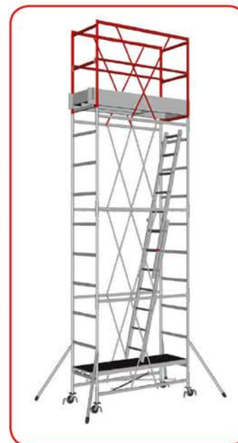
Cervino (completo di accessori)