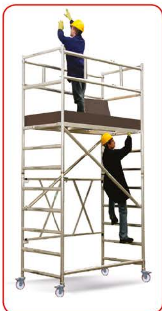
Roller Plus L m 3,46 (Modulo A+B)