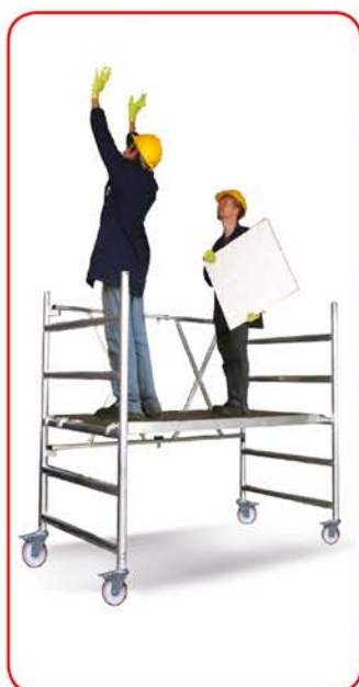
Roller Plus L m 1,70 (Modulo A)