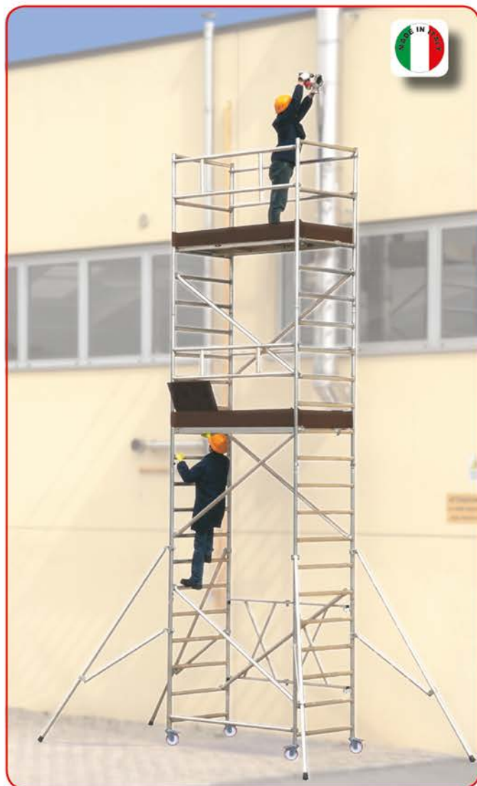
Roller Plus L montato a m 6,76 (moduli A+B+C+D) ingombro base m 2,00x1,05

Roller Plus è una serie di trabattelli in alluminio ad apertura rapida, disponibile in una versione compatta (S) ed una più grande (L). Entrambe le versioni sono a montaggio rapido.